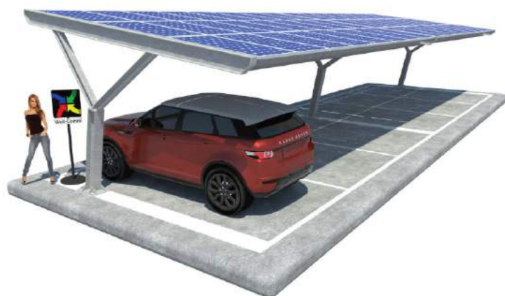
Yvonne su Plinti B