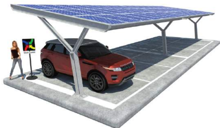
Yvonne su Plinti A