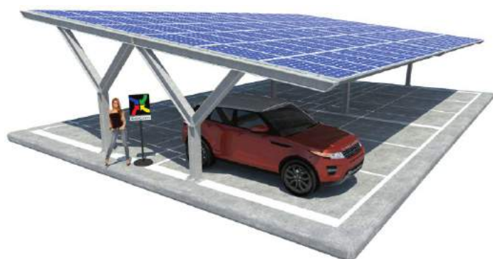
Jasmine su Plinti - doppia fila