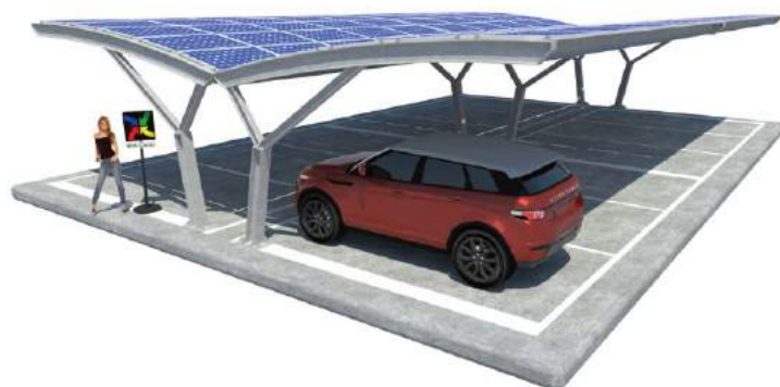
Jasmine su Plinti - doppia fila