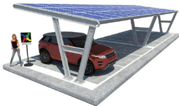
Katia su Plinti