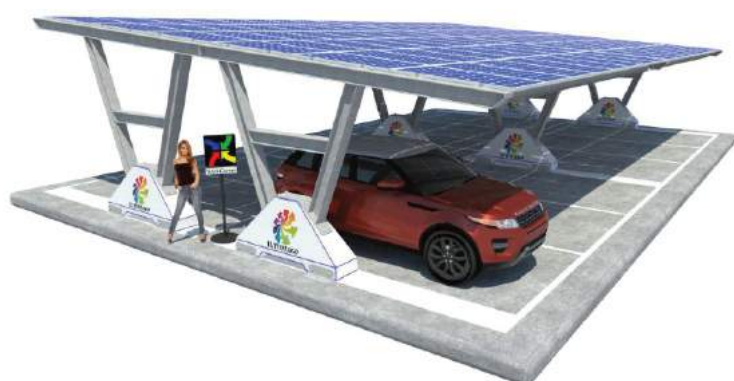
Katia Zavorrata - doppia fila