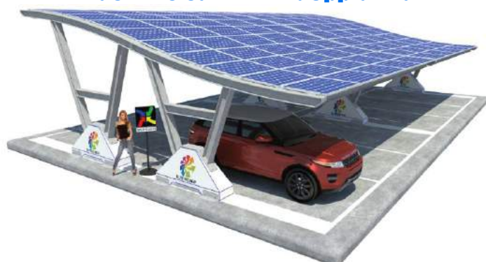
Viktoria Zavorrata - doppia fila