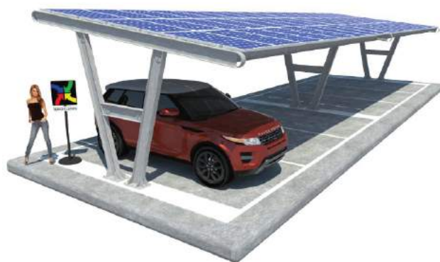
Vera su Plinti