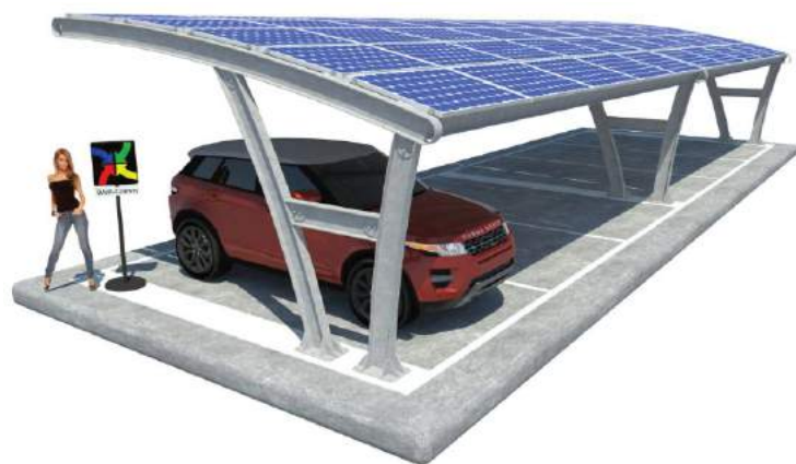
Kristal su Plinti