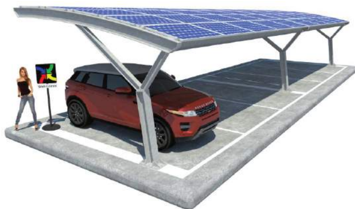
Paola su Plinti

Il nostro intervento non include impianto e collegamenti elettrici