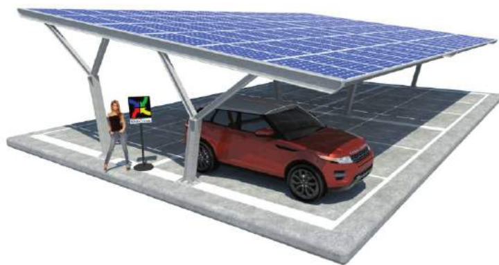
Yvonne su Plinti - doppia fila