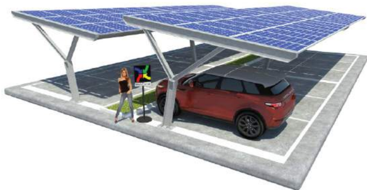
Yvonne su Plinti - doppia fila