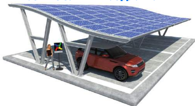
Viktoria su Plinti - doppia fila