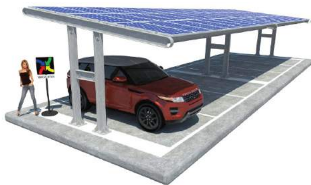
Cassandra su Plinti