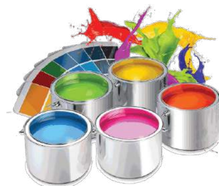
Personalizza con la verniciatura