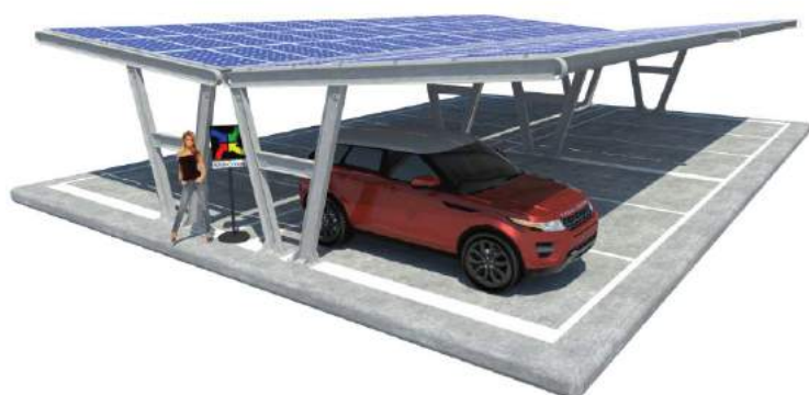
Katia su Plinti - doppia fila