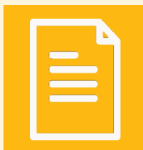
Scheda tecnica del modulo

Affinché i nostri tecnici possano fornire il miglior servizio possibile, è fondamentale che vengano forniti tutti i dati necessari alla formulazione della proposta: